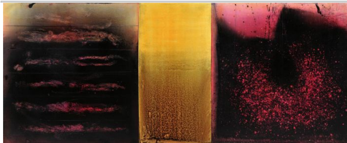
1. La grande palpebra