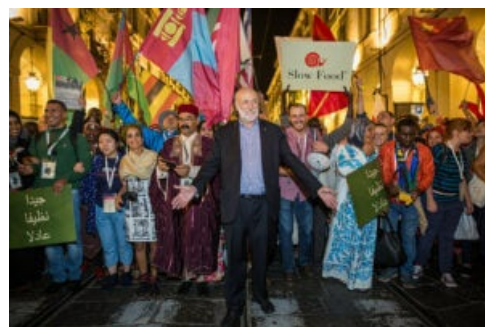
Terra Madre 2016. Carlo Petrini insieme ad alcuni delegati internazionali

La grandezza di Petrini è stata quella di tenere insieme piacere e responsabilità. In anni in cui il cibo si è diviso tra edonismo e moralismo, Carlin difese la "diversità" dentro la comunità: salvare un formaggio, un seme, una razza animale, una ricetta. E non era gesto nostalgico o di recupero mnemonico, anzi, la difesa era un atto culturale e politico nel quale il piacere si materializzava in conoscenza, relazione e consapevolezza. Questa trascendente visione si è tradotta nel tempo in molti progetti concreti, tra questi il Salone del Gusto, Cheese, l'Arca del Gusto, i Presidi Slow Food e gli Orti in Africa.