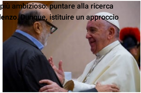
Carlo Petrini con Papa Francesco