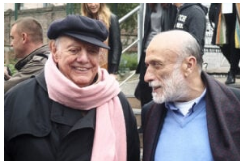
Dario Fo e Carlo Petrini

Nello stesso anno prende forma anche un altro capitolo destinato a lasciare il segno: la nascita della guida Vini d'Italia , pubblicata da Gambero Rosso Editore insieme a Slow Food e curata in team da Daniele Cernilli e lo stesso Petrini. La prima edizione recensiva 1.500 vini di 500 produttori italiani e contribuì a rinnovare la critica enologica internazionale, diventando in breve una delle guide più autorevoli del settore.