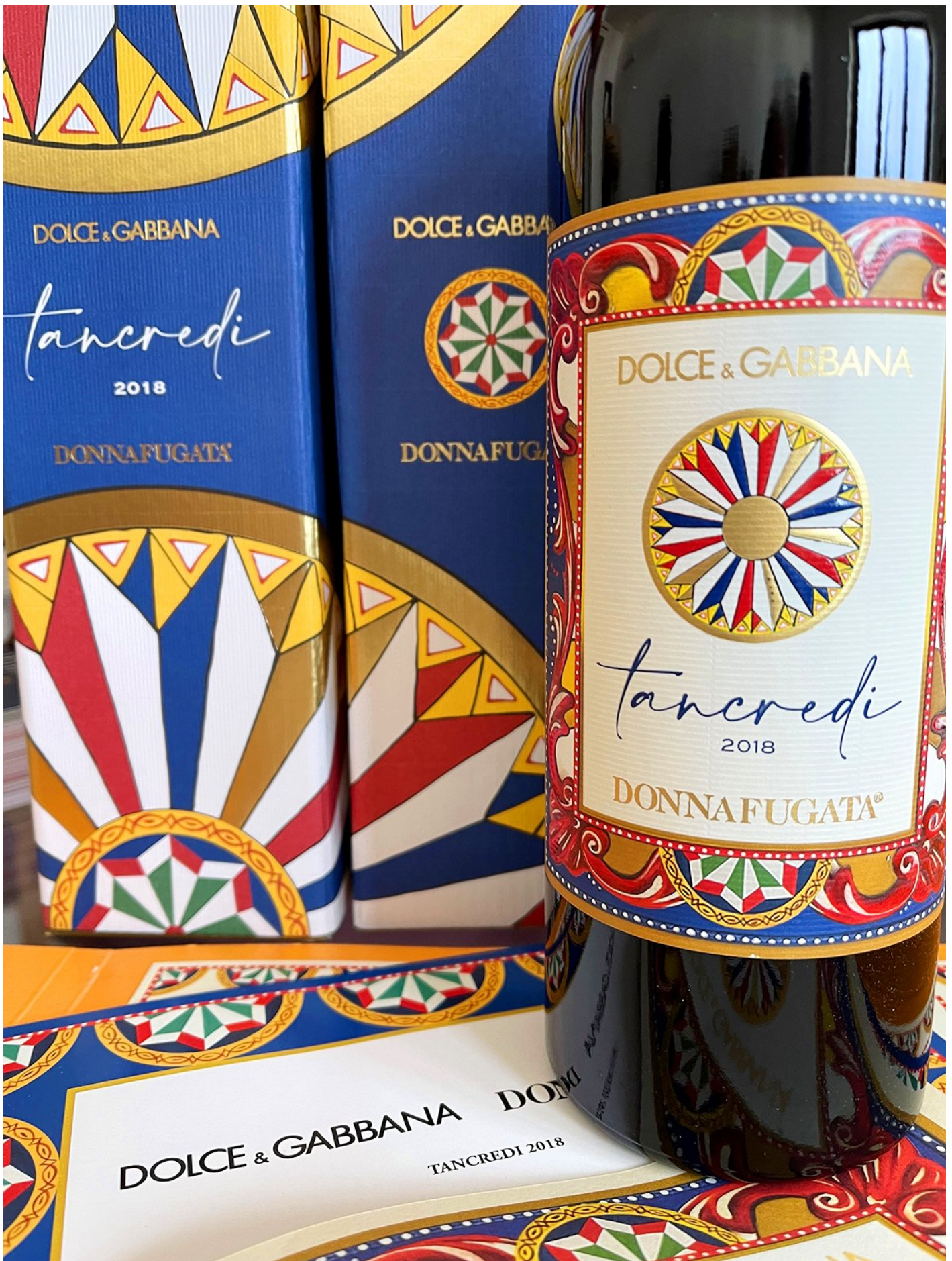
Tancredi 2018 – Donnafugata / Dolce & Gabbana