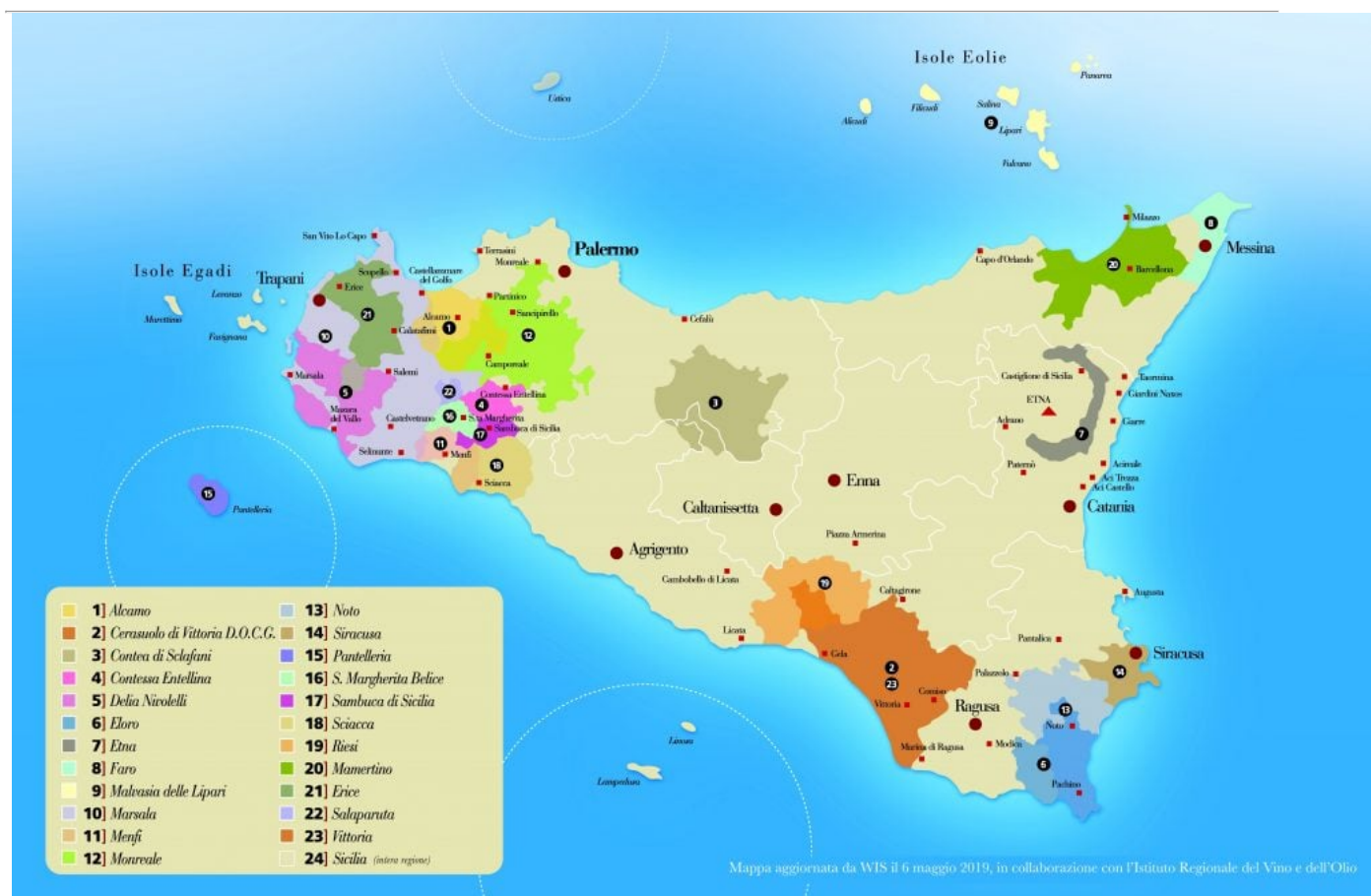
Mappa delle DOC e DOCG di Sicilia. Aggiornamento: 8 febbraio 2022

Irvos: http://irvos.it/servizi/controlli-e-certificazioni/747.html