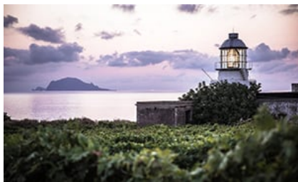
Capofaro, Locanda & Malvasia