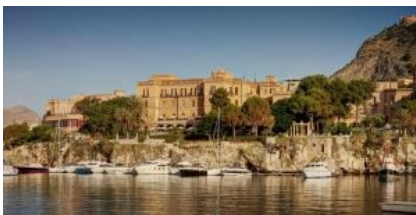
Il Grand Hotel Villa Igiea di Palermo

Storico hotel 5 stelle lusso di Palermo, la sua posizione è particolarmente felice. Si trova, infatti, in uno splendido parco prospiciente il mare, alle spalle ha Monte Pellegrino che la sovrasta. Lo contraddistingue lo stile artistico Art Nouveau, in Sicilia e in Italia conosciuto come "Liberty".