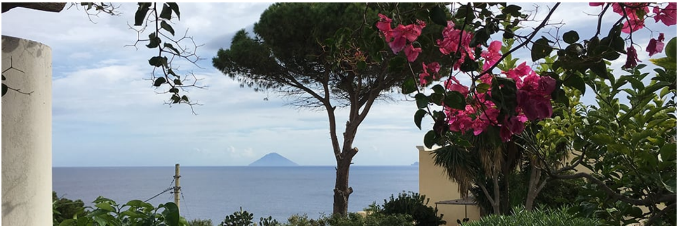
Una delle vedute del Signum di Salina