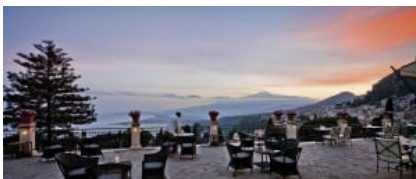
La terrazza del Grand Hotel Timeo, Taormina

Pochi hotel al mondo possono vantare la vicinanza di un sito archeologico. Il Grand Hotel Timeo, una dimora nobiliare ottocentesca nata oltre un secolo fa, primo hotel ad essere costruito a Taormina, si trova di fronte il Teatro Greco e ha vista sul magnifico spettacolo dell'Etna, della baia di Naxos e sui suoi giardini terrazzati. Già famoso nel dopoguerra, non sono mancati ospiti illustri, tra questi Greta Garbo, Sofia Loren, Jacqueline Kennedy, Liz Taylor e Richard Burton. Nel 2018 è entrato nella classifica dei 20 migliori hotel al mondo di Condé Nast Traveller, insieme al Ritz di Parigi, al Lowell di New York e al Mandarin Oriental di Tokyo. Nonostante i criteri presi in considerazione riguardino la struttura, le camere e la qualità della cucina, non esistono dubbi sul fatto che le vedute siano senza eguali al mondo. Il Timeo, così come il vicino hotel sul mare Villa Sant'Andrea, è gestito dalla catena Belmond.